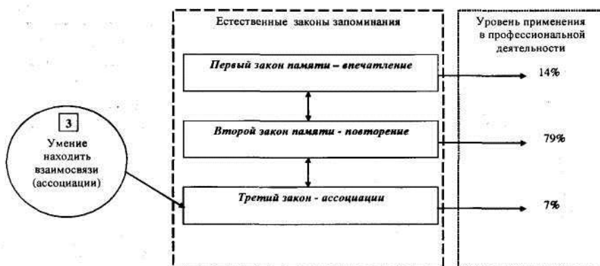
Рис. 2. Уровень применения естественных законов запоминания

Мы можем, встретившись с одним из этих предметов, по ассоциации вспомнить другой, связанный с ним; запомнить что-то — значит связать то, что требуется запомнить, с чем-то уже известным, образовать ассоциацию.